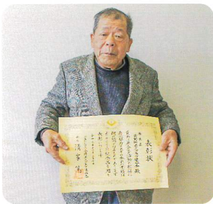
《全国老人クラブ連合会 会長表彰》 ☆優良老人クラブ連合会表彰 吉野町老人クラブ連合会