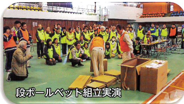
段ボールベット組立実演